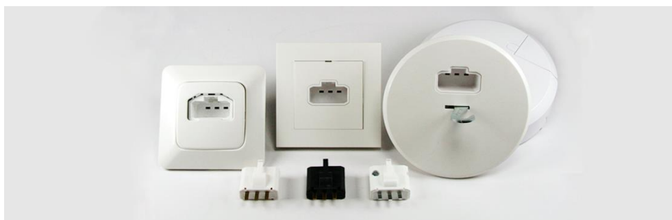
Bild: De nya lampdonen, DCL

Svar: Nedan ser du skillnaden på de nya och gamla lampdonen.