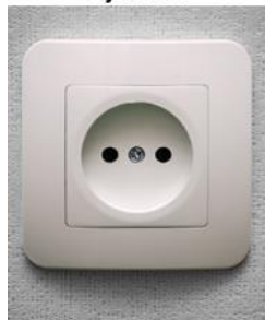
Bild: Ojordat uttag