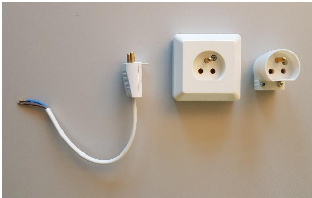
Bild: De gamla lampdonen