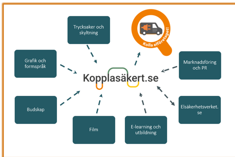
Figur 1 Den digitala tjänsten Kopplasäkert.se är ett nav som tillsammans med övriga produkter och tjänster tillsammans bildar konceptet Koppla säkert.

De flesta övriga aktiviteter i handlingsplanen har som mål att få privatpersoner och återförsäljare att söka svar på frågor om elinstallationer i den digitala tjänsten Kopplasäkert.se. Från Kopplasäkert.se kan användaren söka sig vidare till att hitta ett registrerat elinstallationsföretag i Elsäkerhetsverkets e-tjänst Kolla elföretaget eller för att hitta fördjupad relaterad information på Elsäkerhetsverket.se.